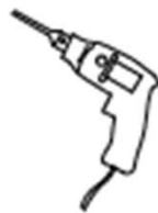
Drill Perceuse Taladro